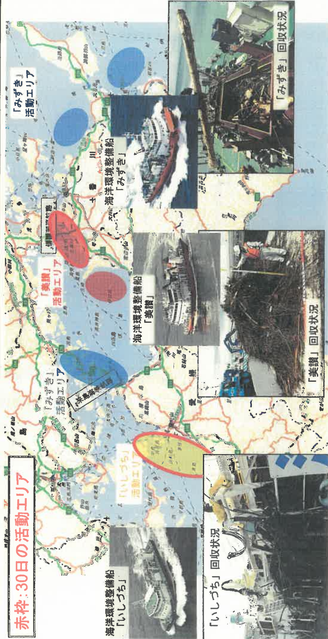
海洋環境整備船 「いしづち」