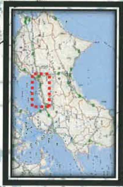
全面通行止め箇所の解除の見通し(県管理道路)