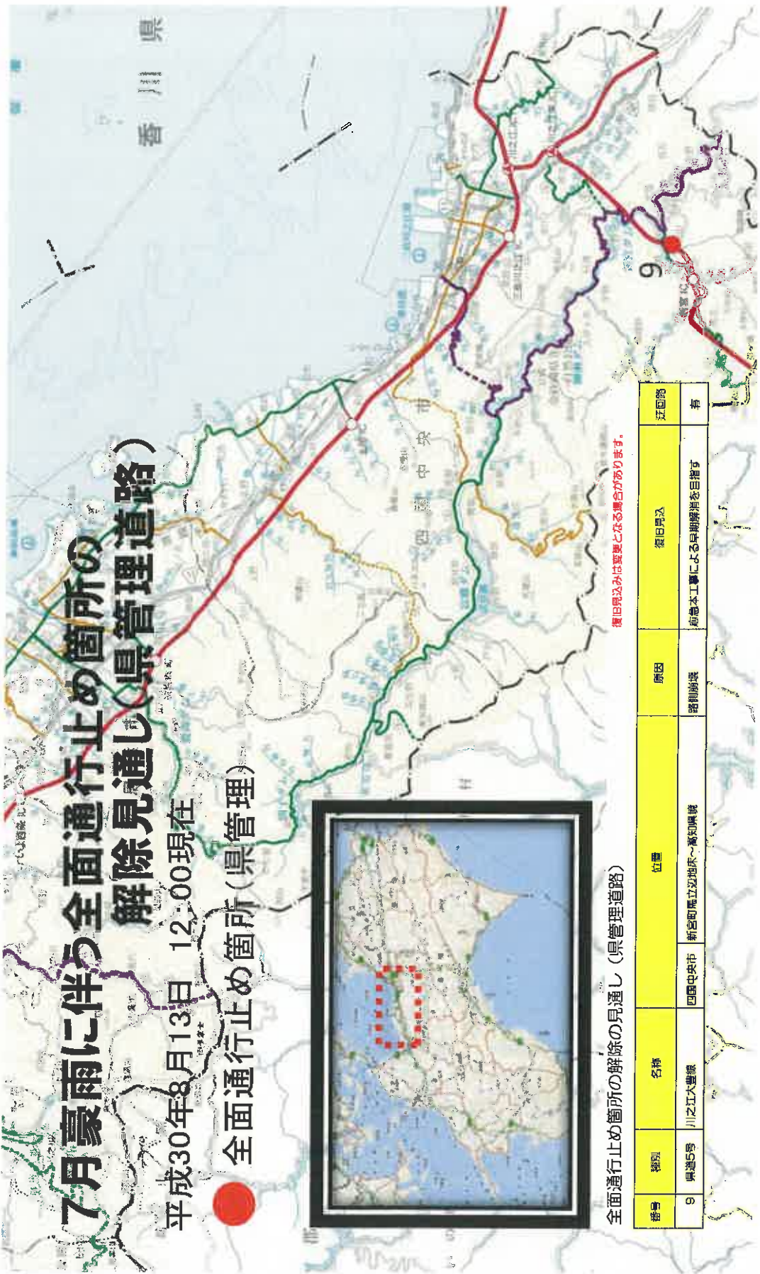
全面通行止め箇所の解除の見通し(県管理道路)