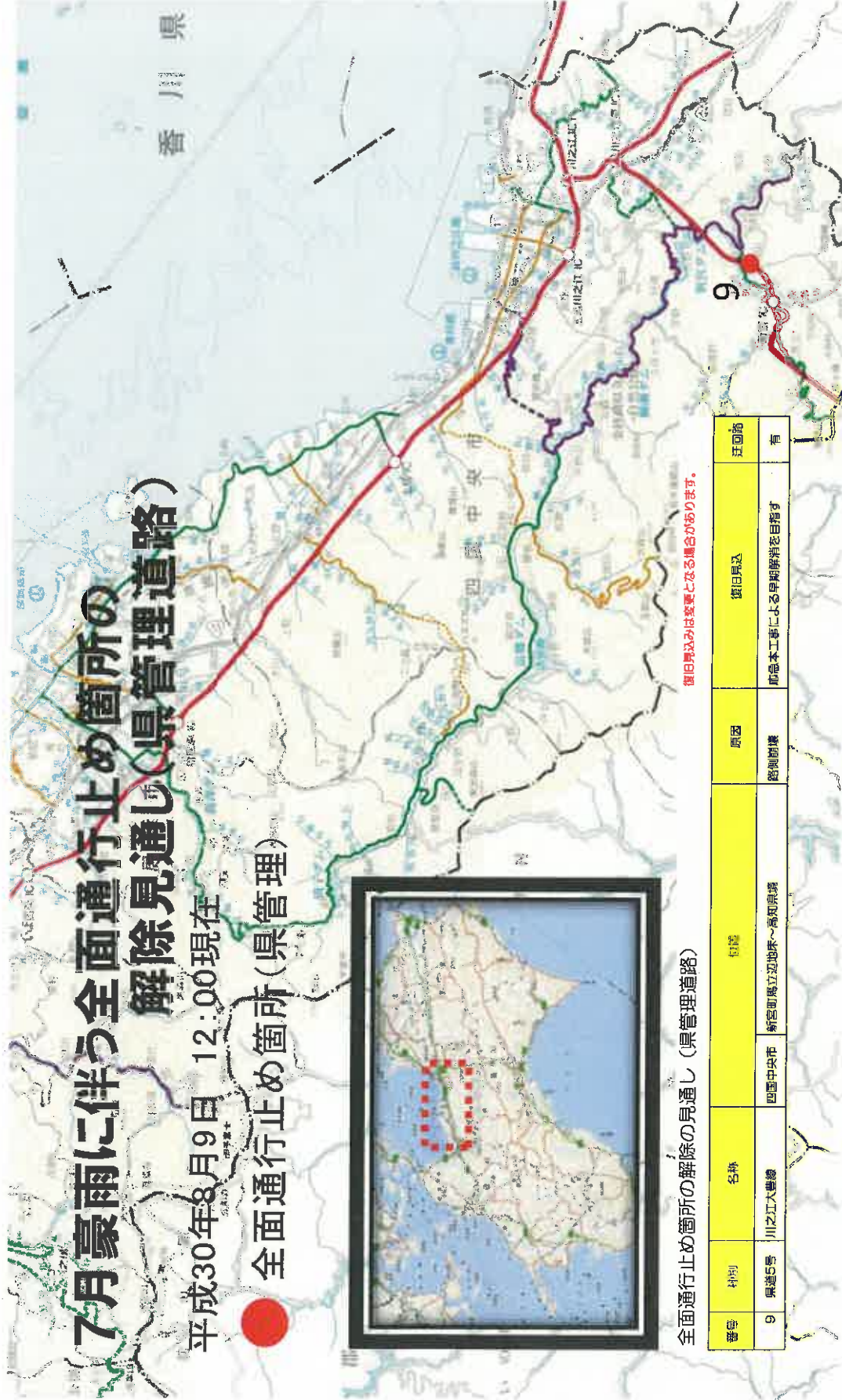
全面通行止め箇所の解除の見通し(県管理道路)