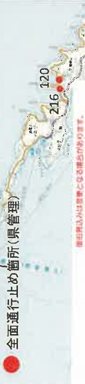
全面通行止め箇所の解除の見通し(県管理道路)