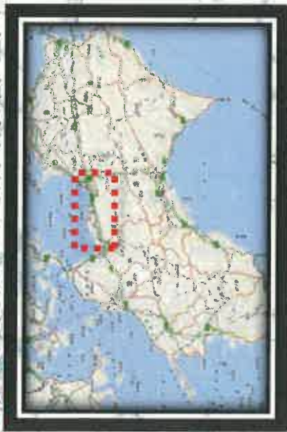
主な全面通行止め箇所の復旧の見通し(県管理道路)