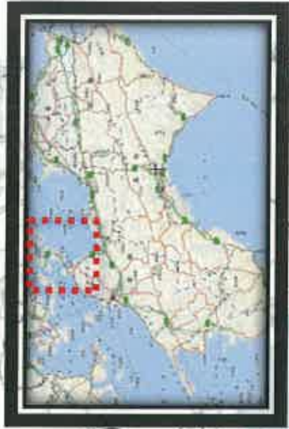
主な全面通行止め箇所の復旧の見通し(県管理道路)