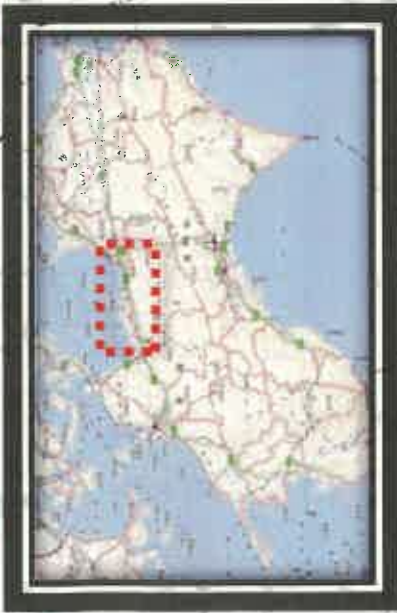
全面通行止め箇所の解除の見通し(県管理道路)