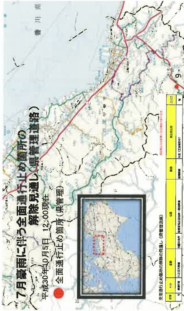
全面通行止め箇所の解除の見通し(県管理道路)