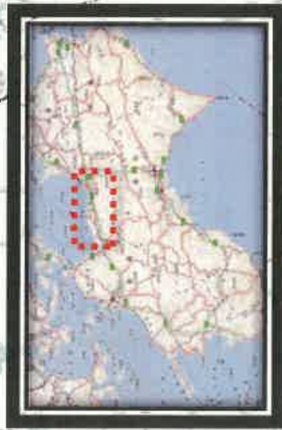
全面通行止め箇所の解除の見通し(県管理道路)