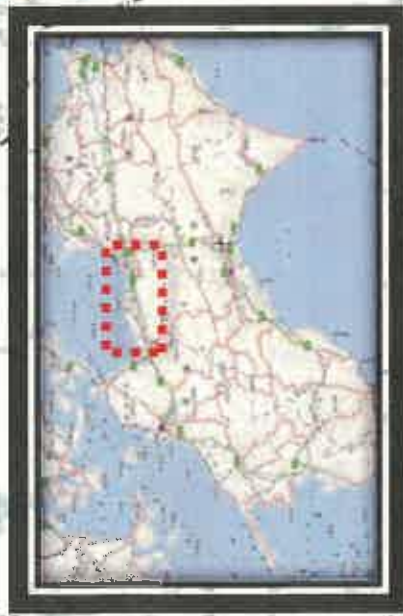
全面通行止め箇所の解除の見通し(県管理道路)