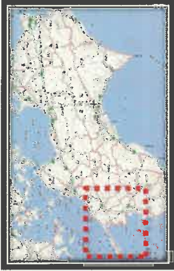
全面通行止め箇所の解除の見通し(県管理道路)