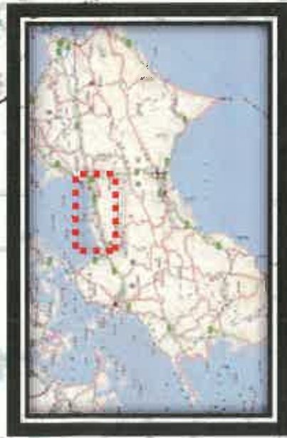
全面通行止め箇所の解除の見通し(県管理道路)