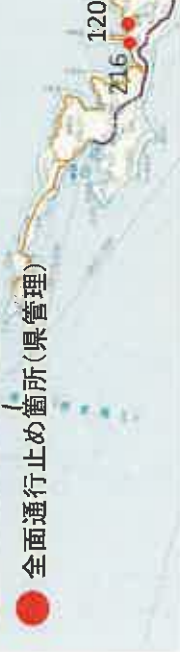
全面通行止め箇所の解除の見通し(県管理道路)