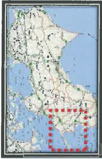
全面通行止め箇所の解除の見通し(県管理道路)