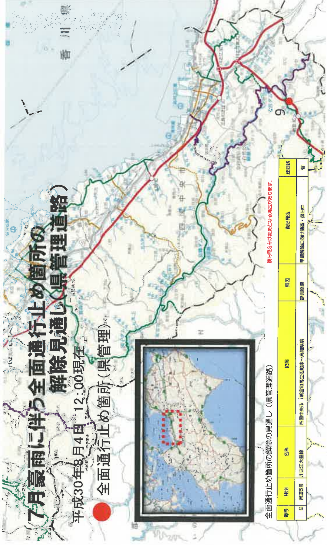
全面通行止め箇所の解除の見通し(県管理道路)