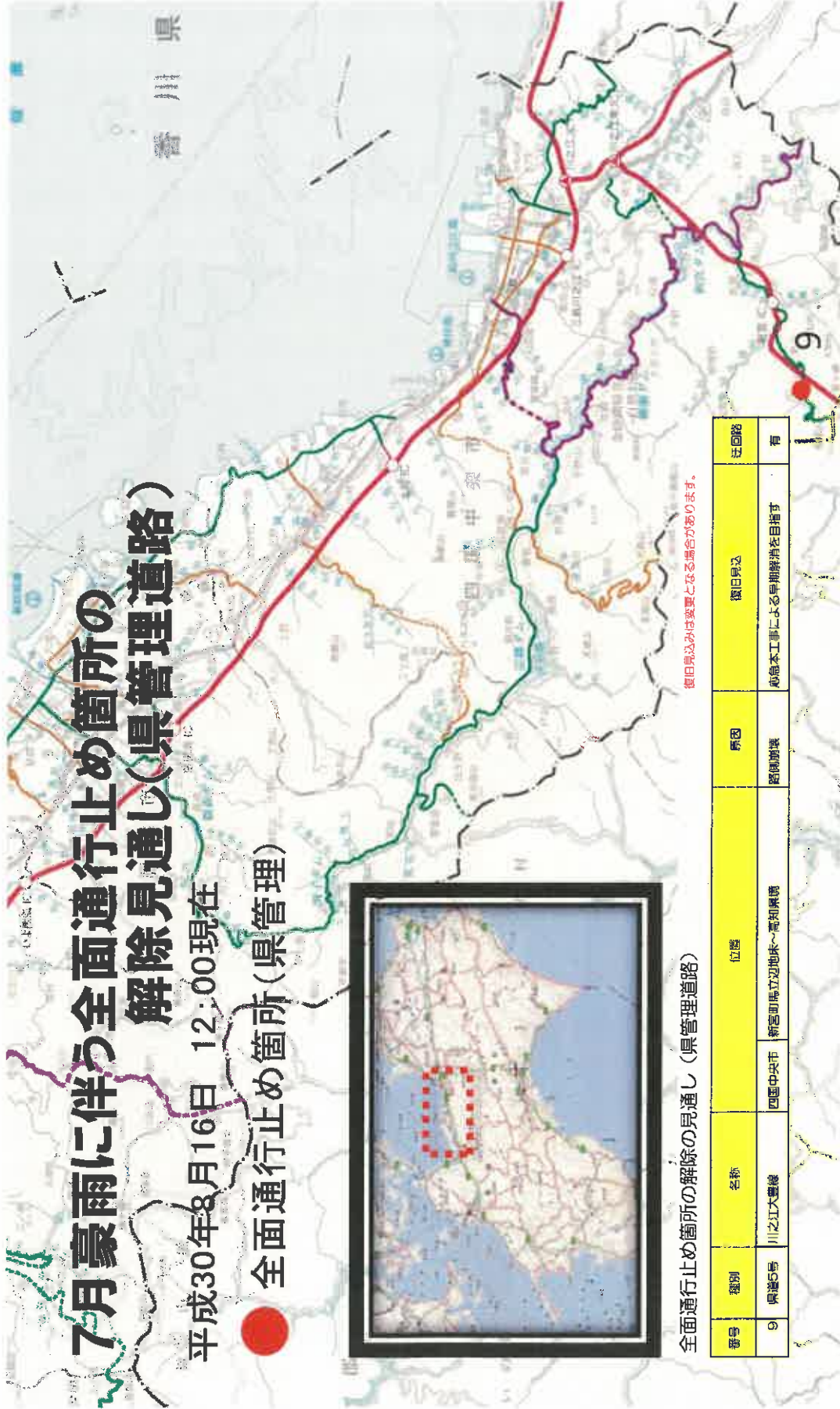
全面通行止め箇所の解除の見通し(県管理道路)