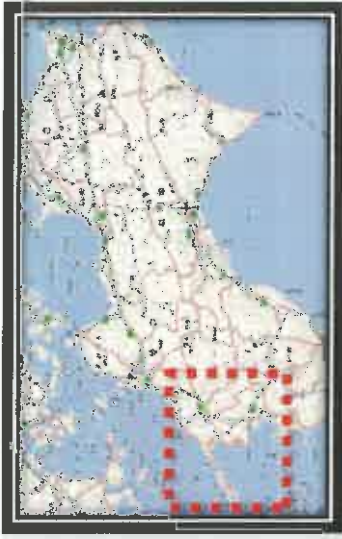
全面通行止め箇所の解除の見通し(県管理道路)

大分県 / 平成30年8月16日 12:00現在 ● 全面通行止め箇所(県管理)