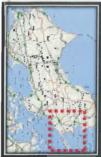
全面通行止め箇所の解除の見通し(県管理道路)