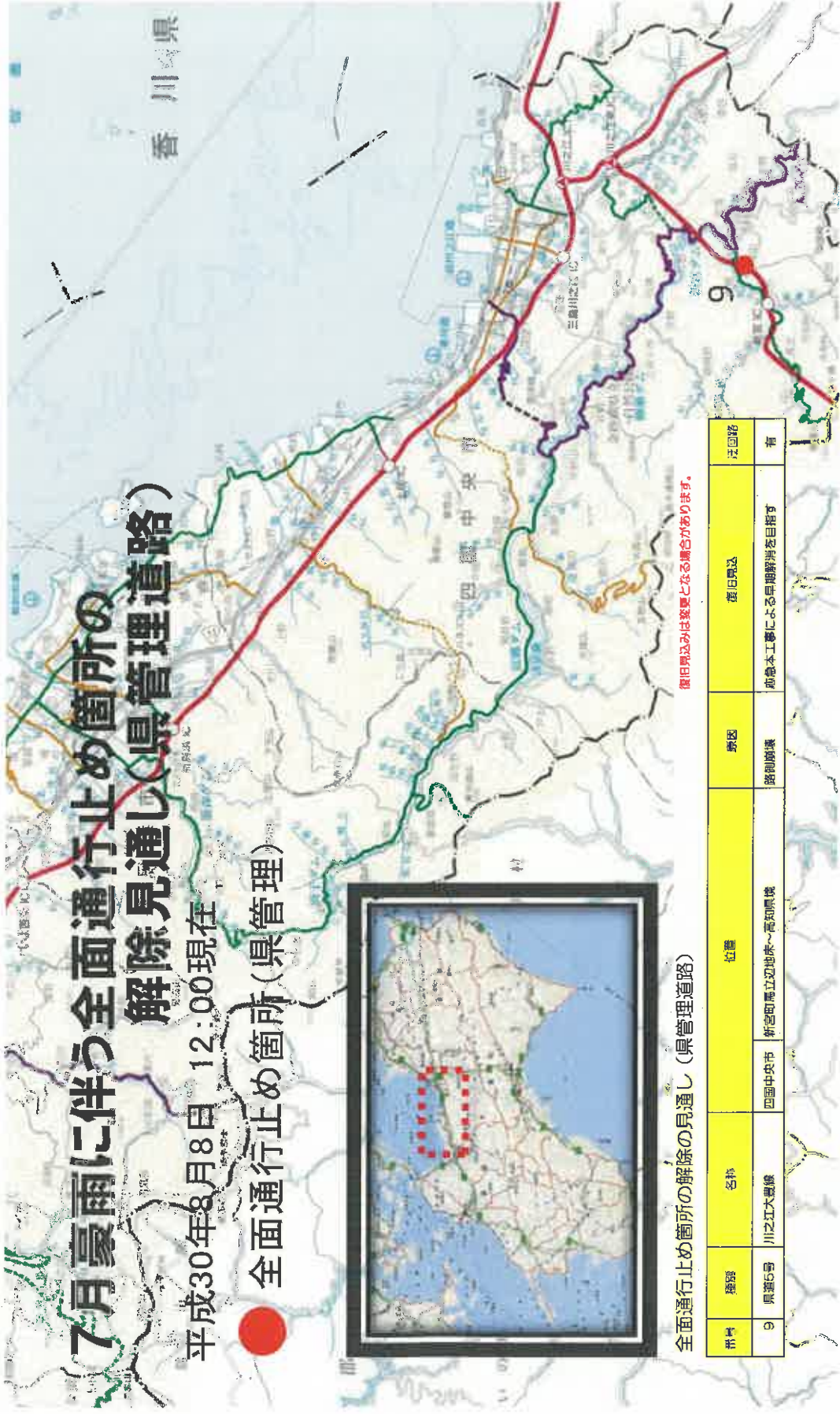
全面通行止め箇所の解除の見通し(県管理道路)