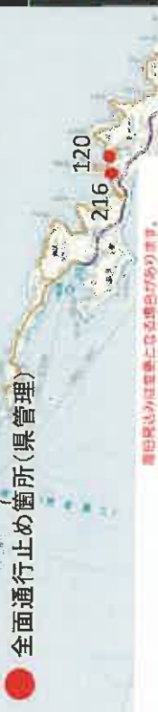
主な全面通行止め箇所の解除の見通し(県管理道路)