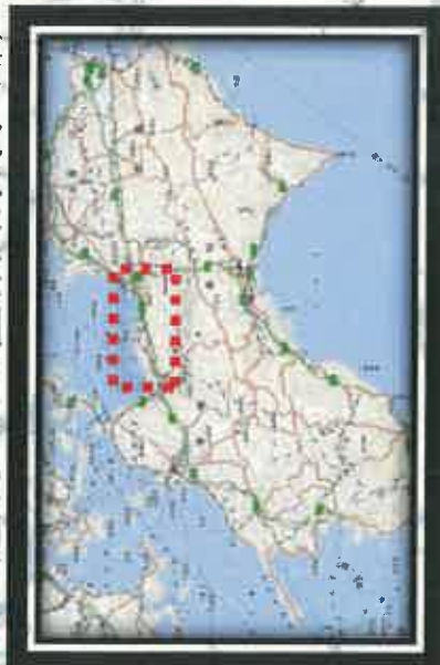
主な全面通行止め箇所の復旧の見通し(県管理道路)